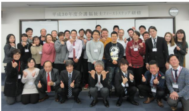
平成30年度受講生と講師