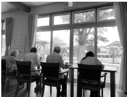
食堂から園庭を望む