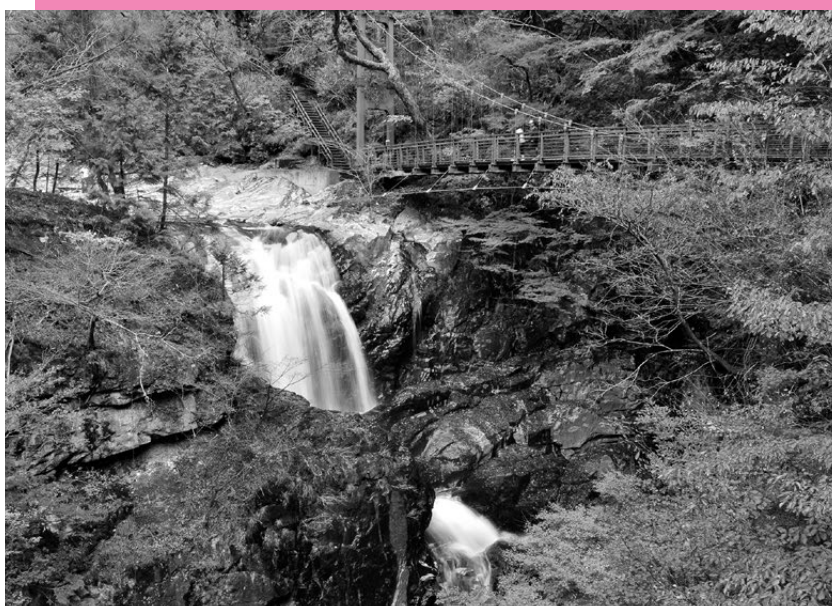
天川村「みたらい渓谷」